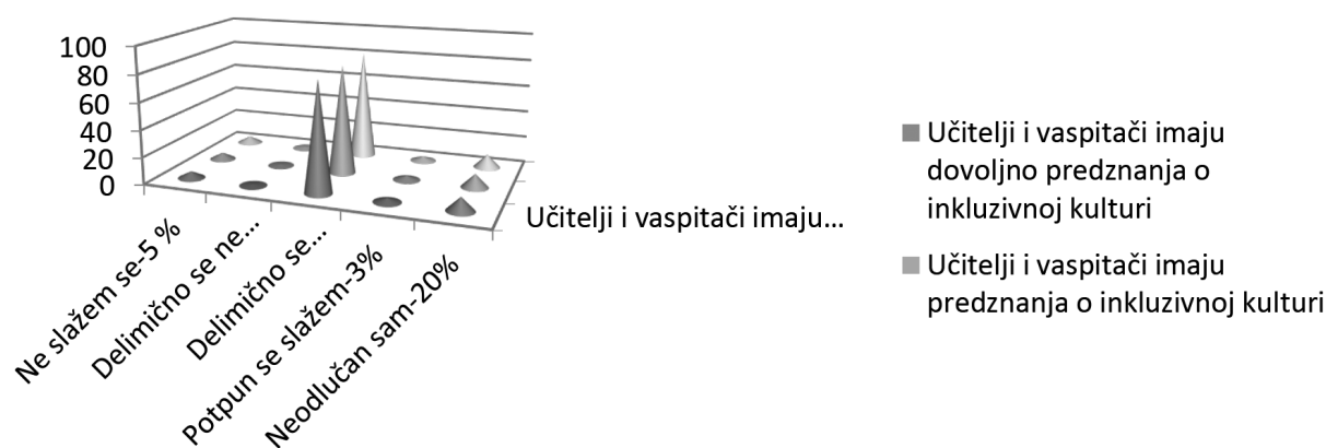
Grafikon 3. Struktura ispitanika u odnosu na predznanje o onkluziji

Na tvrdnju Učitelji i vaspitači imaju dovoljna predznanja o inkluzivnoj kulturi najveći broj ispitanika se delimično slaže njih 81 ili 81%, neodlučnih je 10 ili 10%, ne slaže se njih 5 ili 5% , delimično se slaže 3 ili 3 % dok je samo 1 ispitanik koji se delimično ne slaže.