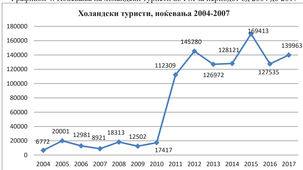
Графикон 4: Ноќевања на холандски туристи во РМ за периодот од 2004 до 2017