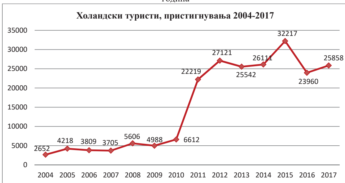
Графикон 3: Пристигнувања на холандски туристи во РМ за периодот од 2004 до 2017 година