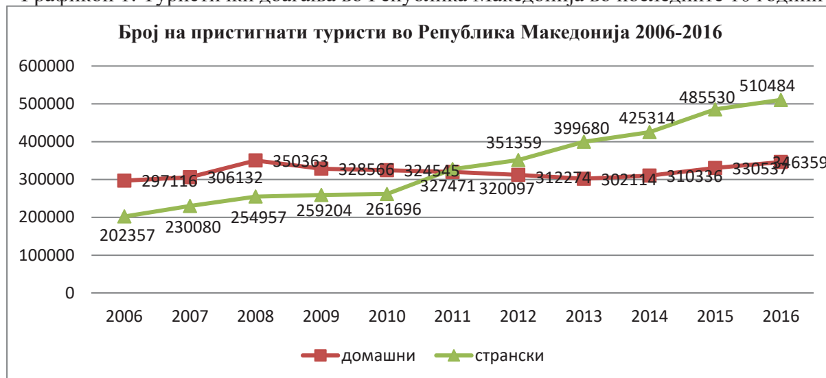
Графикон 1: Туристички доаѓања во Република Македонија во последните 10 години